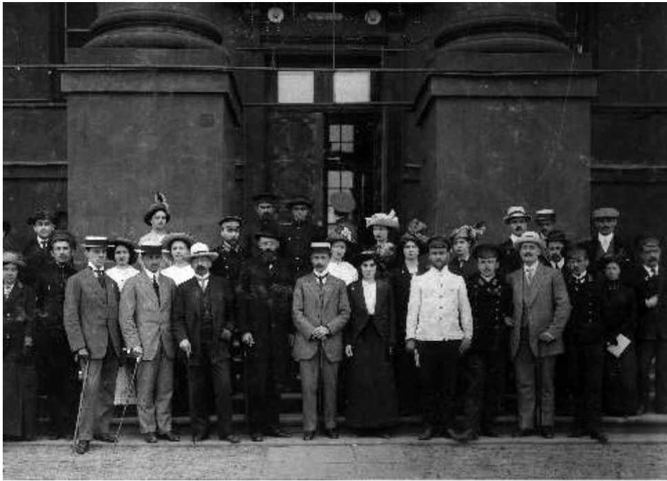
Викладачі, студенти та курсистки (вільнослухачки Університету), 1910-ті рр.

вільних відвідувачок було в декілька разів більшим: в Харківському – 450, в Московському – 308, Петербурзькому – 279, Новоросійському – 130 сторонніх слухачок 20 . А в цілому в країні кількість вільнослухачок російських університетів 1906–1908 рр. складала, за офіційними даними, 2130 осіб – майже половину усіх сторонніх слухачів університетів 21 .