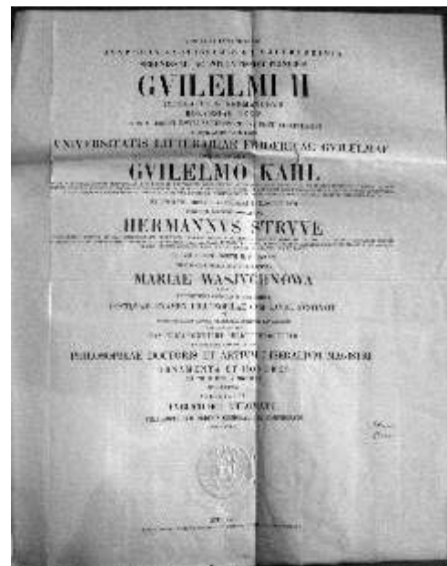
Диплом доктора філософії хіміка Марії Васюхнової. Університет Фрідріха-Вільгельма, Берлін, 1909 р.

Дискримінаційна політика щодо жінок зумовила те, що лише незначна кількість з них – найбільш здібних та відданих науці – змогли на початку ХХ ст. розпочати наукову кар'єру в Університеті св. Воло-